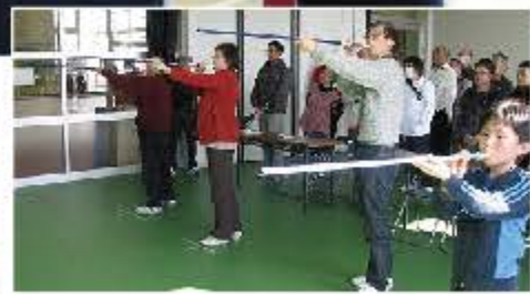
左から健康体操(コバトレ)、体力テスト、スポーツ吹矢 下からシャフルボード