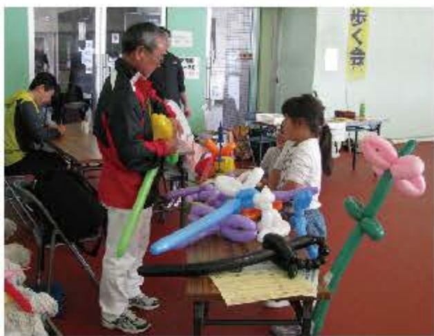
バルーンアートは就学前の子どもたちに人気