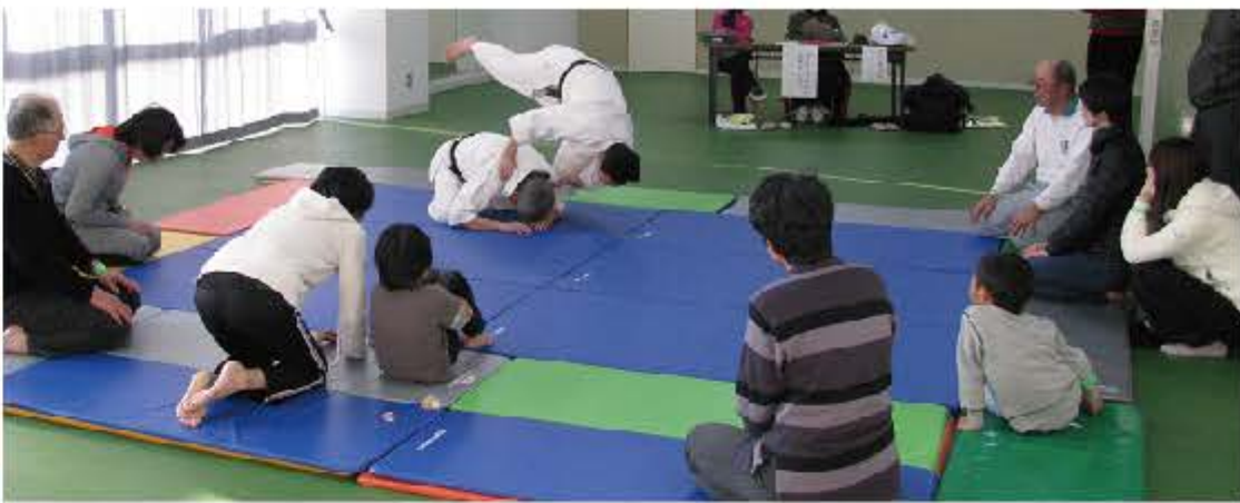
＜左＞フットサル＜上＞合気道＜右＞健康マージャン ＜下＞シルバーリハビリ体操